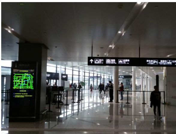
到着後 右へこの突き当り3番出口が地下鉄出入り口