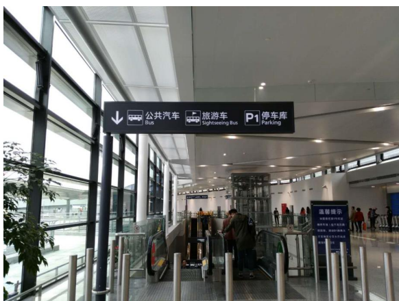
エスカレーターで地下B1に降り地下通路利用

1F 到着ロビーのエスカレーターで地下B1に降り—地下通路—エスカレーターで地上の無料シャトルバス（穿梭車）乗り場に向かいます。