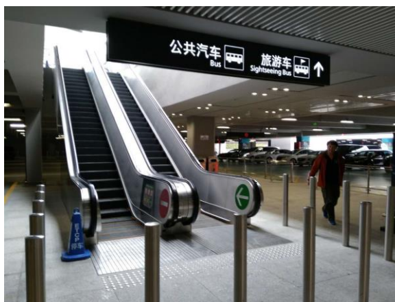
地下通路から再びエスカレーターで地上へ