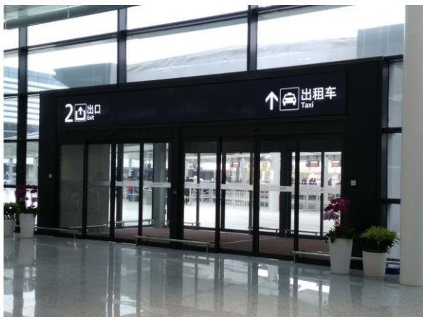
タクシー乗り場 2番出口